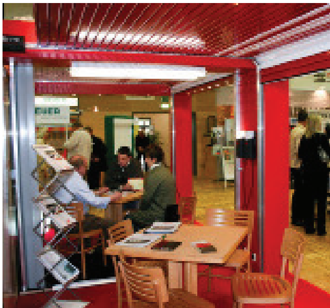
Beratung wird auf der Messe Niedersachsen BAU groß geschrieben.